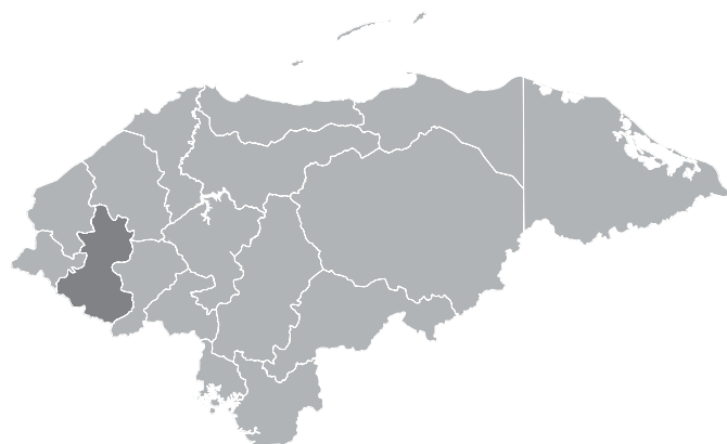
Ubicación del departamento de Lempira